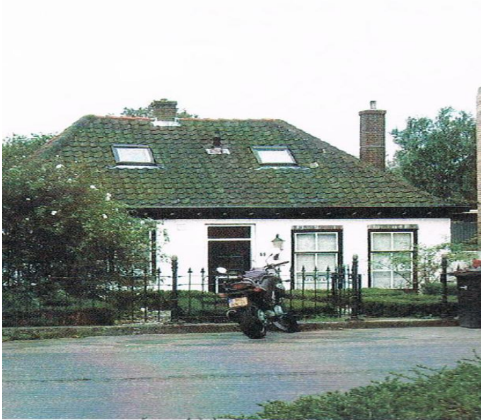
Het huisje aan de Neckerstraat nummer 11

Na een jaar noeste arbeid konden we op 26 januari 2013 ons nieuwe onderkomen aan de Neckerstraat 11 officieel laten openen.