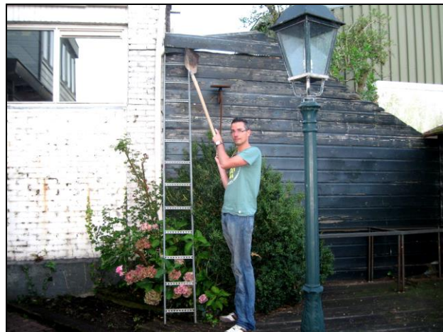
Waar is die schep anders voor??

Voorblad: Slot Purmersteyn te Purmerend met slotgracht anno 1625. (kopergravure Claes Janszoon Visscher)