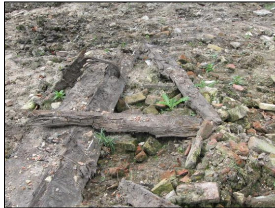
(afb.2 – 17 september 2009)

In oktober 2010 werd een begin gemaakt met de voorbereidingen voor het bouwwerk. Géén archeoloog te bekennen. Toch werd er wéér behoorlijk diep de grond in gegaan (afb.3). Eerst graven en daarna vullen met zand.