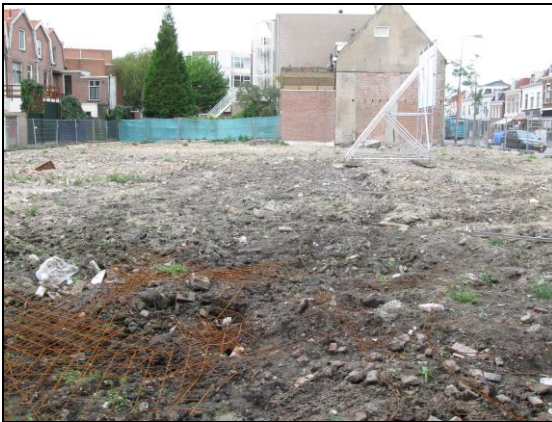
(afb.1 – 17 september 2009)

De Nieuwstraat 22 tot en met 38 is voor de AWP een geheel mislukt project geworden. In 2009 was er al sprake van een archeologisch onderzoek na de sloop van de gebouwen op deze locatie (afb.1). De sloper had erg zijn best gedaan en hier en daar waren de funderingen tot losliggende bakstenen op het maaiveld te herkennen. De grond was omgewoeld getuige de vele scherven en houtresten op het oppervlak. Via buurtbewoners krijgen wij te horen dat de kraanmachinist ook al zijn eigen werk had gedaan. Nog even doorgaan na werktijd, lekker diep graven en putten leeghalen. Na een kleine veldverkenning waren inderdaad de houtresten te herkennen wat eens een beerbak moet zijn geweest (afb.2). Ook de nog aanwezige resten beer/fecaliën uit de put met enkele scherven maakten toch weer een verslagen gevoel bij ons los.