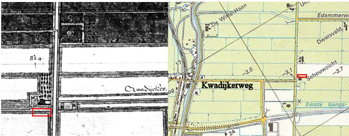
(detail kaart 1633)

De boerderij komt al voor op een kaart uit 1633 en wellicht was het interessant om het uitbaggeren te volgen en konden hier misschien nog enkele gebruiksvoorwerpen verzameld worden welke een indicatie kunnen geven van de welstand van de boerderij in vroegere tijden. Omdat ook een deel langs de sloot afgegraven werd kon de eventuele aanwezigheid van onbekende funderingen direct in kaart worden gebracht.